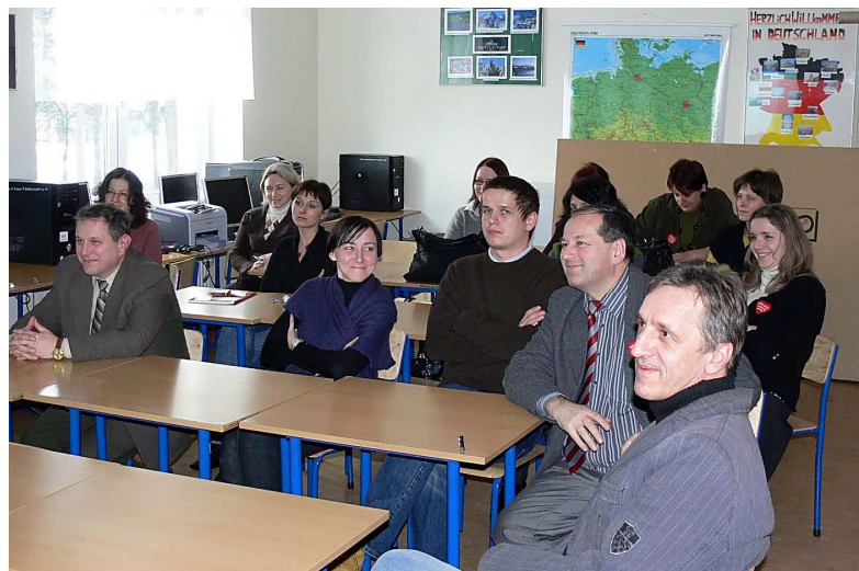
Die Schulungsteilnehmer (Schulleitung und Lehrer)