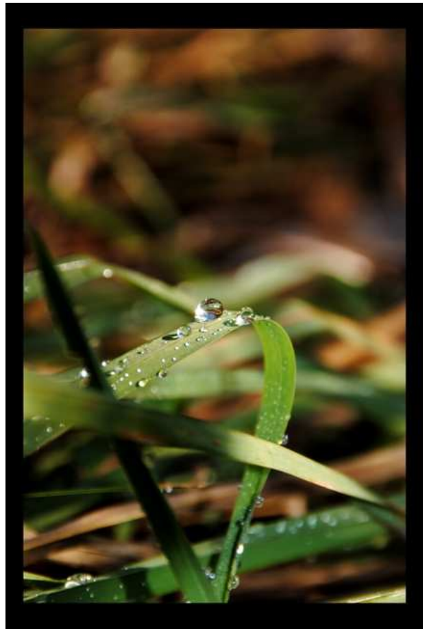
III miejsce – Izabella Kaczmarczyk (uczennica klasy III d)